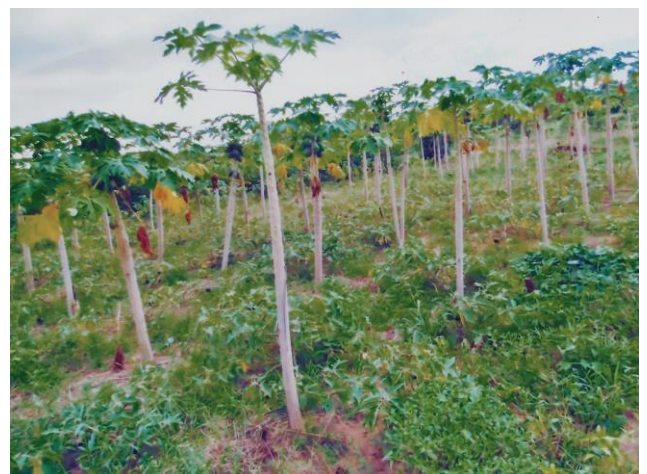
Plantation de papayers