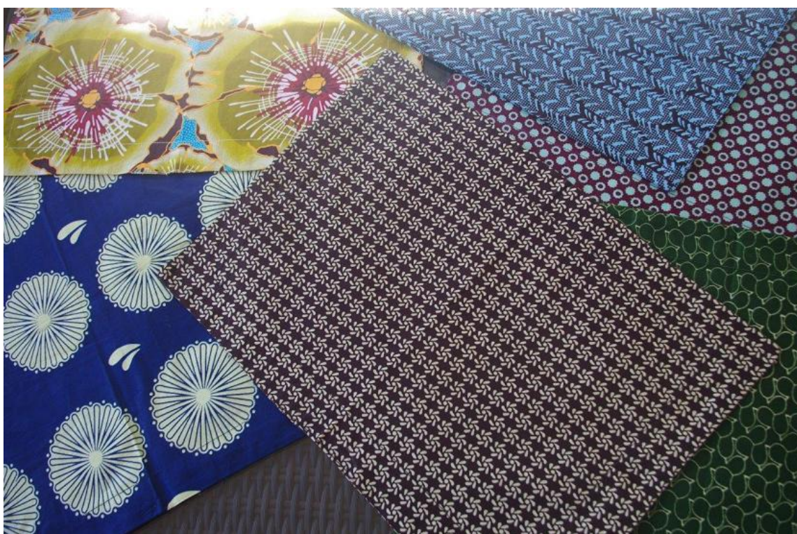
Quelques exemples des sets de table réalisés

Moramour a passé commande à l'association des femmes Benkadí de sets de table que les couturières ont réalisés dans de beaux tissus africains. Nous les proposerons soit à la commande soit en vente directe lors des diverses manifestations au stand Moramour pour aider au financement des projets futurs.