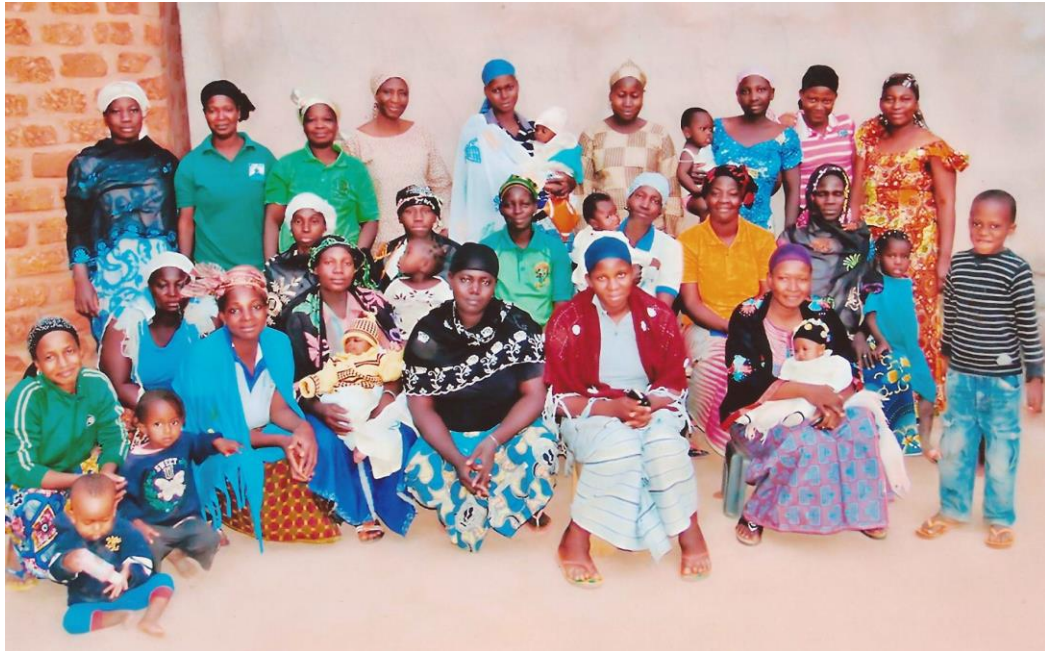
Le Groupement de femmes Benkadi, associées pour la tontine